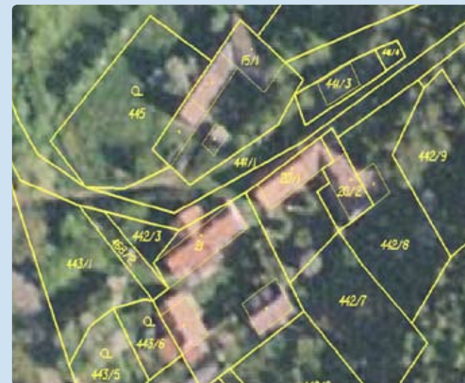
Ortofoto s obrazem katastrální mapy

Údaje o hranicích pozemků je možné zpřesnit dvěma způsoby. Pokud vlastníci mají označeny nesporné hranice pozemků v terénu (zdmi, ploty, hraničními znaky v lomových bodech), zeměměřič tyto hranice zaměří, a po porovnání s dosavadními méně přesnými údaji vyhotoví geometrický plán.