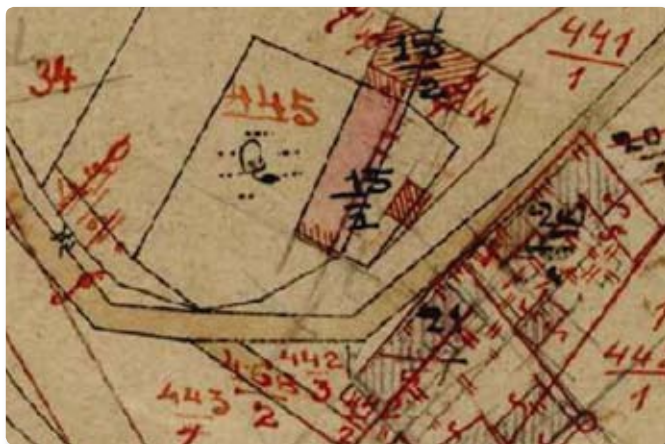
Mapa bývalého pozemkového katastru, která je výchozím podkladem pro digitalizaci katastrální mapy v měřítku 1:2880

Na našem území probíhají zeměměřické činnosti pro účely evidence pozemků od dob Josefa II. Poslední ucelené mapování celého území bylo započato za vlády Františka I. a dokončeno okolo poloviny 19. století. Od té doby bylo zahájeno množství projektů mapování našeho území, avšak vlivem neustálých politických a společenských změn již nebyl žádný dokončen, mapování se omezilo zejména na větší města a obce. Důsledkem toho je rozdílná kvalita mapového díla v různých částech Česka a tím i různá spolehlivost údajů katastru nemovitostí o poloze lomových bodů hranic pozemků. Různá byla v minulosti i přesnost údajů v geometrických plánech, kterými byly do katastrální mapy vyznačovány změny v průběhu jejího vedení v aktuálním stavu.